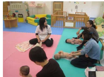
13日(火)お誕生日会 ベビーマッサージの先生に血行を良くする方法を教えてください、楽しい時間を過ごしました。