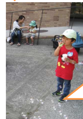
25日 イクメン 倶楽部