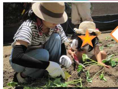
22日 さつま芋の苗植え