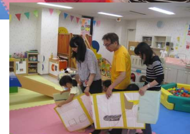
21日じじぼん 紙芝居