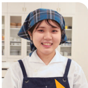
3年生 〈出身高校〉 大阪府立登美丘高等学校