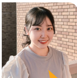
4年生 〈出身高校〉 早稲田摂陵高等学校