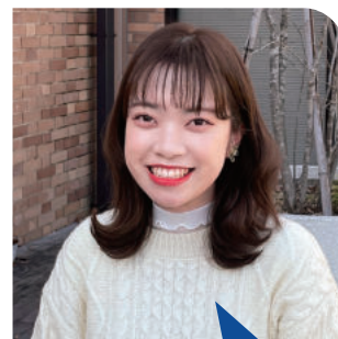
4年生 〈出身高校〉 尼崎市立尼崎高等学校