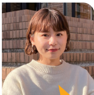
4年生 〈出身高校〉 兵庫県立三田西陵高等学校