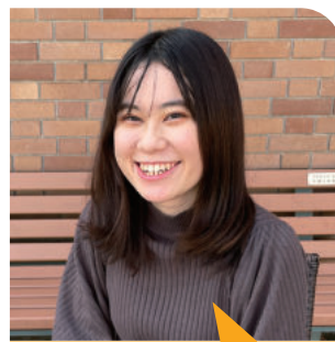
4年生 〈出身高校〉 兵庫県立川西北陵高等学校