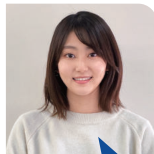
3年生 〈出身高校〉 兵庫県立大学附属高等学校

大学は自由で楽しく、自分次第でたくさんのことを経験できる場所です。神戸松蔭で皆さんと一緒に学ぶことができる日を楽しみにしています。