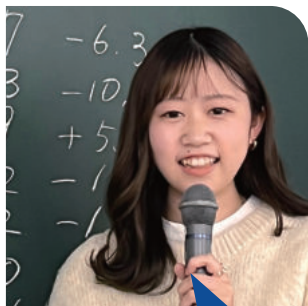
4年生 〈出身高校〉 兵庫県立福岡高等学校