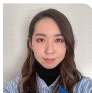
3年生 〈出身高校〉 兵庫県立西宮高等学校

是非皆さんも神戸松蔭女子学院大学都市生活学科に入学して新しい自分に会ってください!